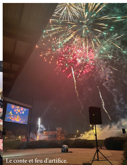
Le conte et feu d'artifice.