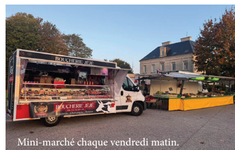
Mini-marché chaque vendredi matin.