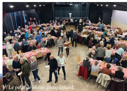
Le petit déjeuner campagnard.