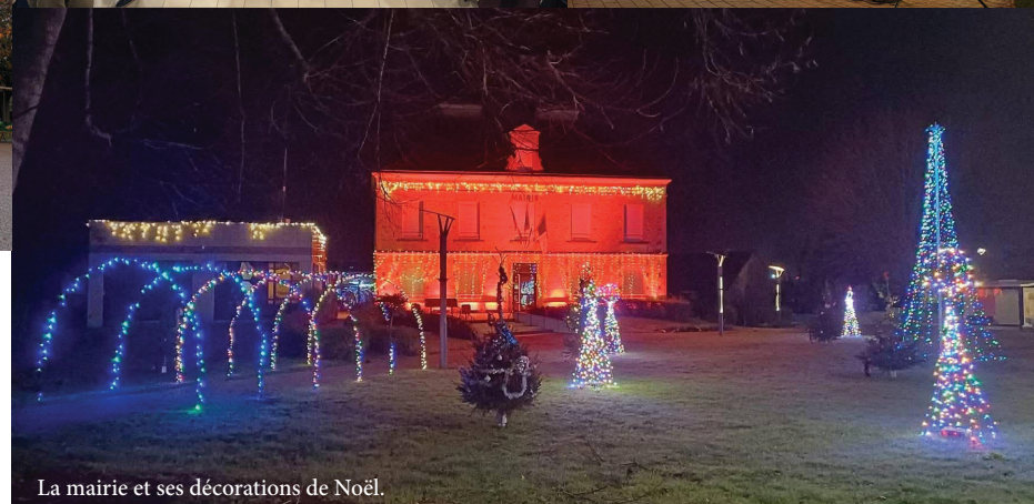
La mairie et ses décorations de Noël.