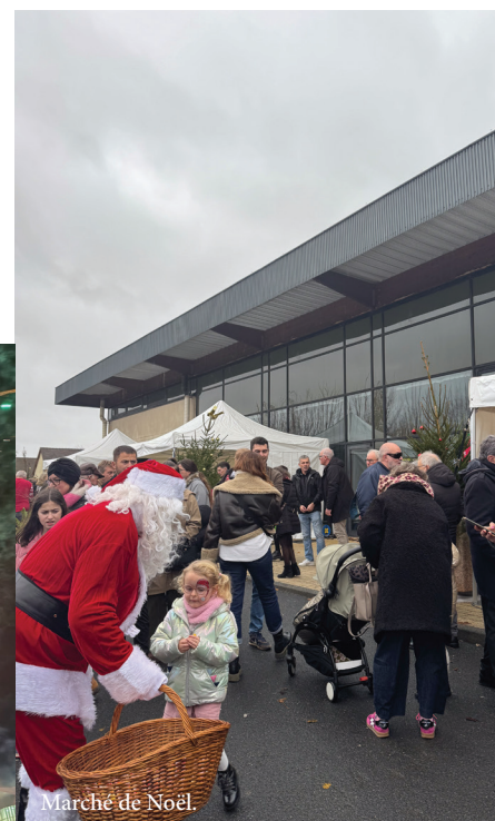
Marché de Noël.